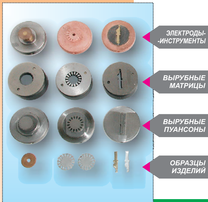
Образцы инструментов и изделий